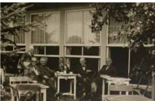
Als bejaardensociëteit had Dennenhof een prachtig terras met uitzicht op de IJzeren Vrouw.

Het mooiste stadspark van 's-Hertogenbosch krijgt dit jaar een extra impuls. Het leegstaande Dennenhof Paviljoen krijgt een exploitante die er met Britse zwier drankjes en heerlijkheden gaat verkopen.