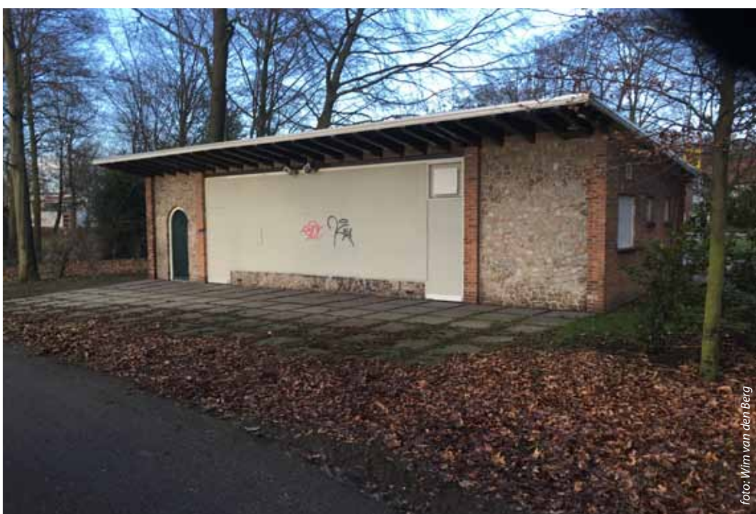
Paviljoen Dennenhof anno 2016. De glasgevel komt terug.